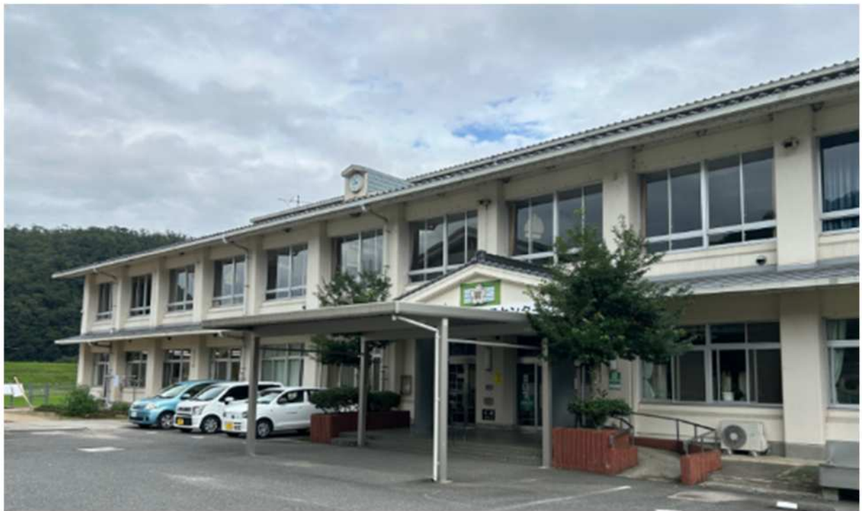
物件写真（デイサービス施設 機能回復訓練室）