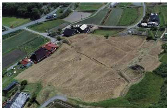
史跡寺町廃寺跡航空写真