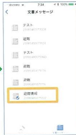
③確認したいメッセージを選択