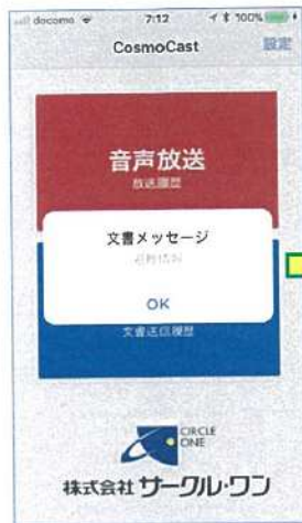
①タイトル (例: 避難情報) が表示されます