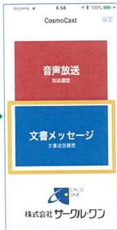
②文書メッセージを選択