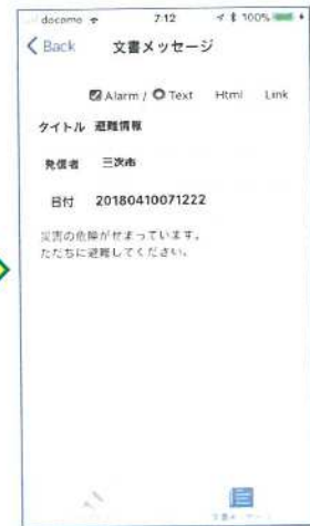
④本文を確認できます