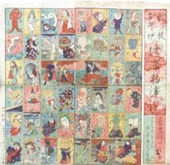
「新板おどげけ物つくし」長谷川小信 江戸時代以降