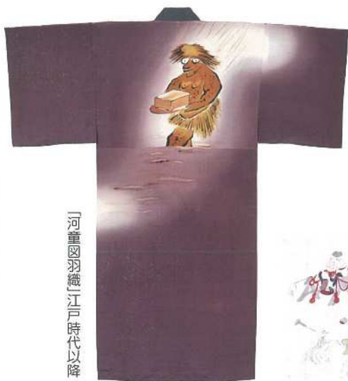
「河童図羽織」江戸時代以降