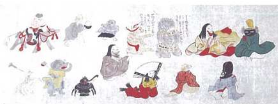
「付喪神絵巻」上巻(部分) 江戸時代 ※後期は別場面を展示。