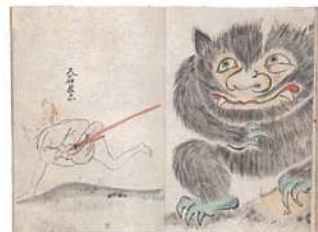
「大石兵六」江戸時代 ※前期は別場面を展示。