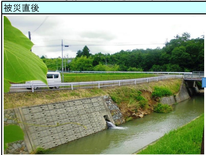
市道神杉104号線 道路災害復旧工事（三次市廻神町）