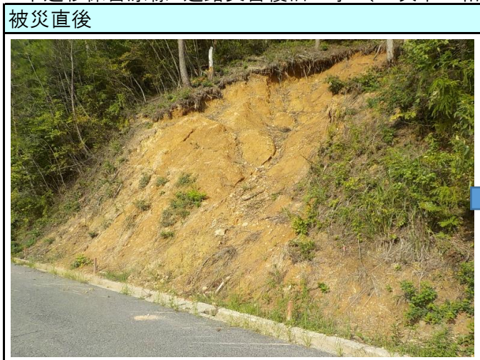
市道杉保吉原線 道路災害復旧工事（三次市三和町飯田）