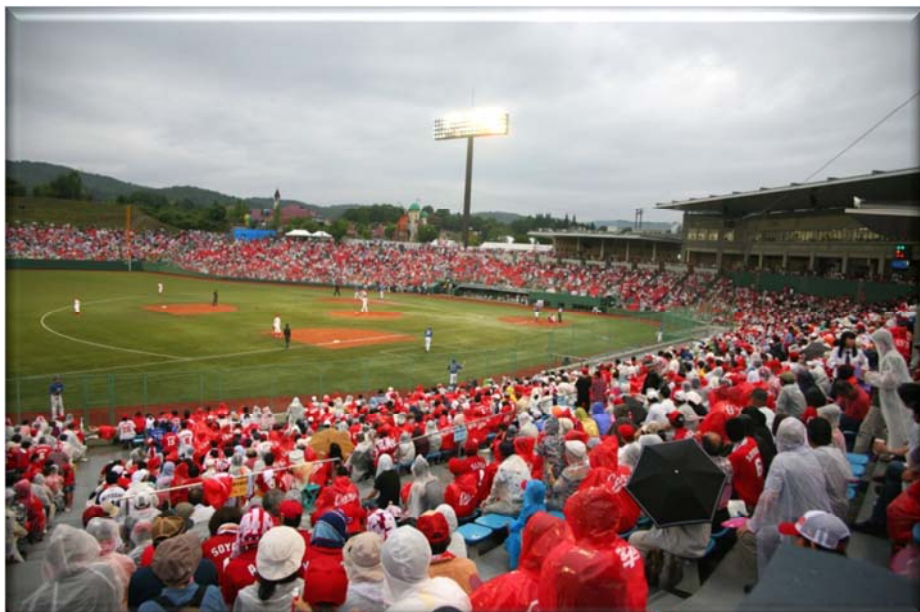
平成27年度プロ野球公式戦開催 （三次市みよし運動公園野球場）