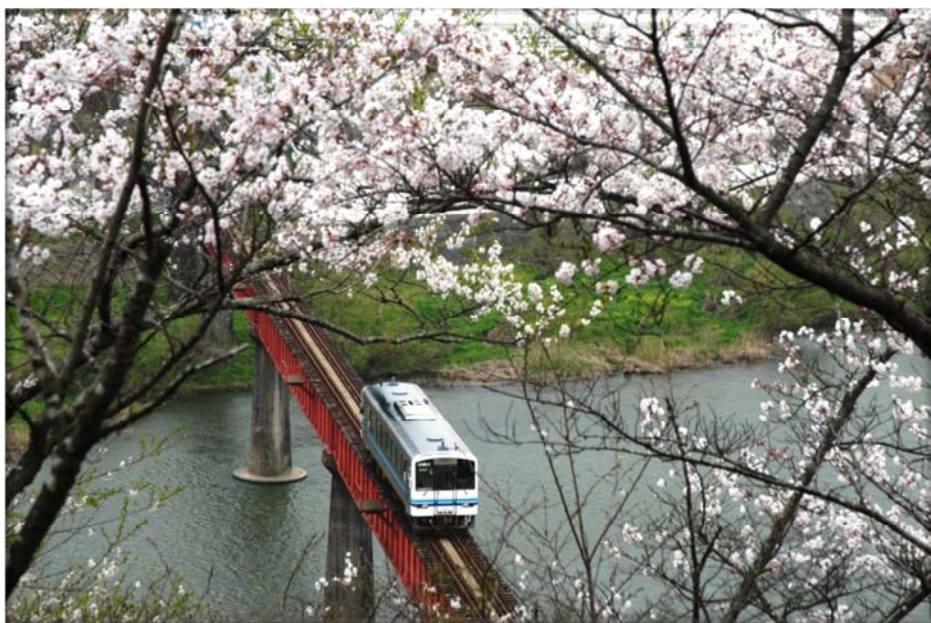
三江線と尾関山の桜