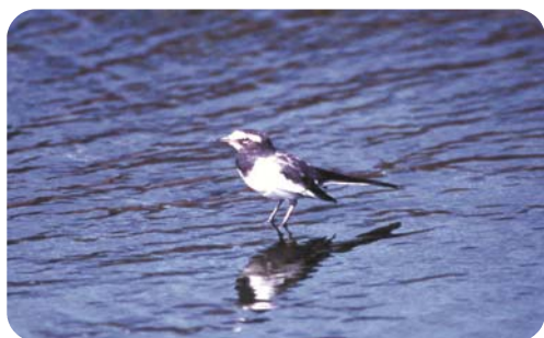
市の鳥 セグロセキレイ