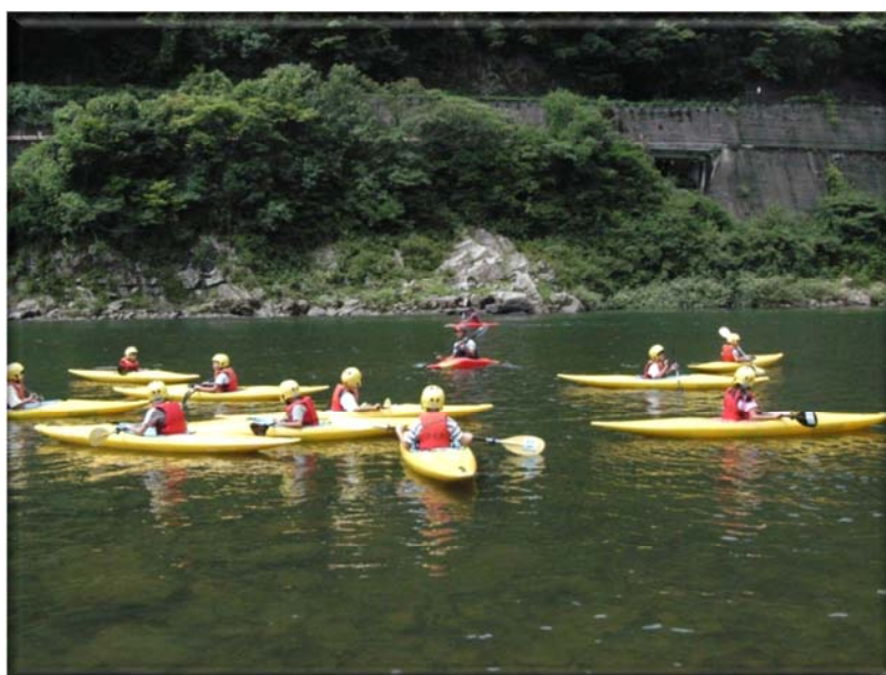
江の川カヌー公園さくぎ