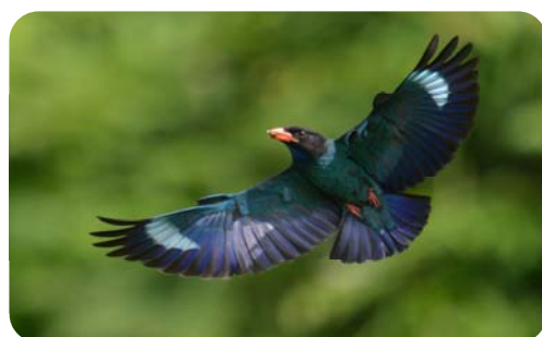
市の鳥 ブッポウソウ