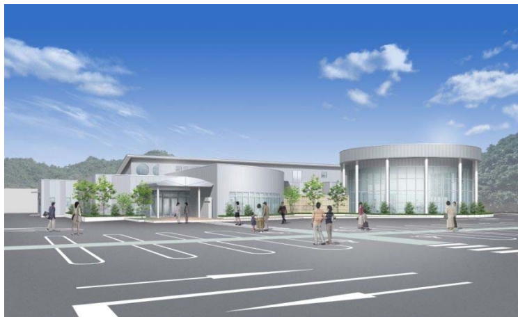
甲奴健康づくりセンター「ゆげんき」イメージ図