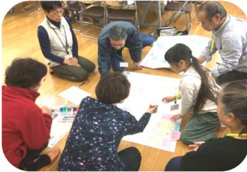
まちづくりビジョンの策定