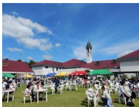
広島三次ワイナリー