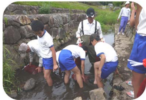
河川環境整備活動