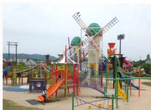
みよし運動公園 みよしあそびの王国