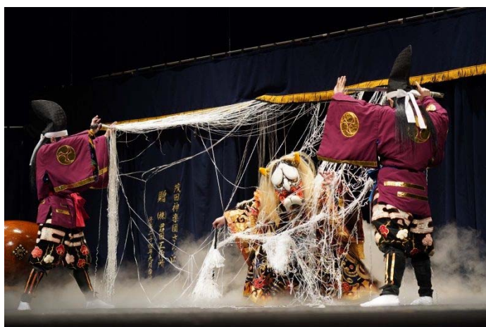
三次市民ホール きりり