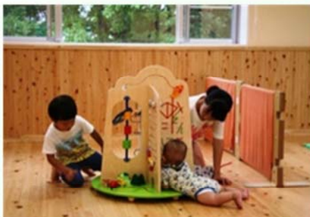
こどもの室内遊び場 みよし 森のポケット