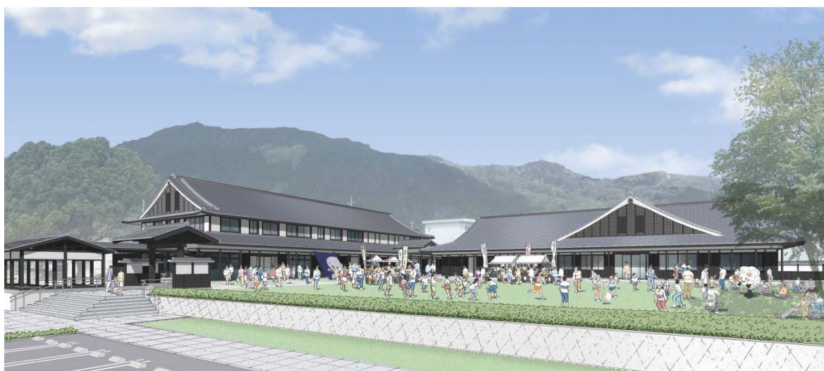
三次地区拠点施設 イメージ図