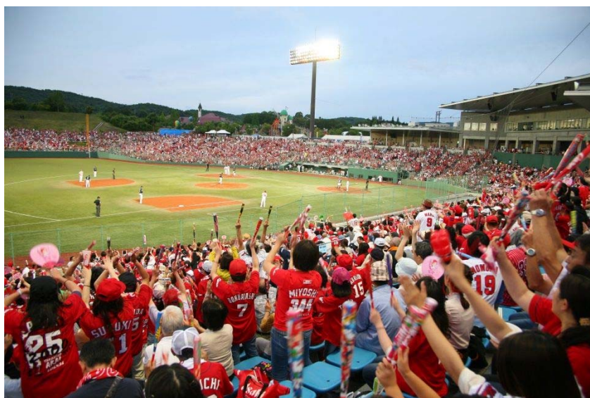
プロ野球公式戦 (三次きんさいスタジアム)