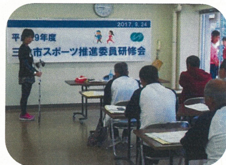
三次市スポーツ推進委員研修会 (9/24、三次市)