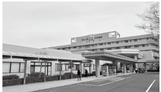
老朽化が懸念される市立三次中央病院

市立三次中央病院の建て替えは、建設費の高騰、物価や人件費の上昇、診療報酬改定の影響による病院事業の収支悪化により、基本設計を策定した段階で建て替え事業を一旦中断することとなっている。市民にとっても生命と健康に大きく関係する重要な施設である。事業再開の判断基準をどのように設定するのか。