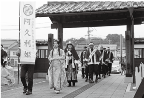
尾関山公園 100 周年記念事業「忠臣蔵義士行列」

尾関山公園 100 周年記念事業の講演会や、11 年ぶりの赤穂浪士義士行列は大盛況であった。忠臣蔵を通じた歴史学習や郷土愛の醸成、地域活性化の観点から、これら記念事業を今後も継続していく考えはないか伺う。