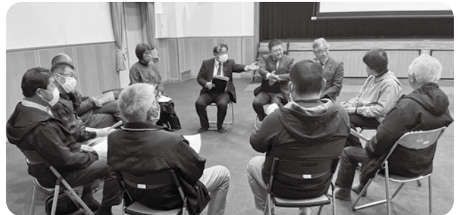
第2部ワークショップ (君田会場)