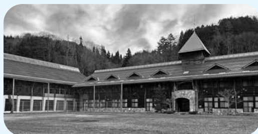
横谷ふるさとセンター（布野町）

※普通財産…市の業務目的に使われなくなった財産で、売却・貸付など多様な用途に活用できる。