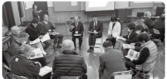
第2部ワークショップ (河内会場)