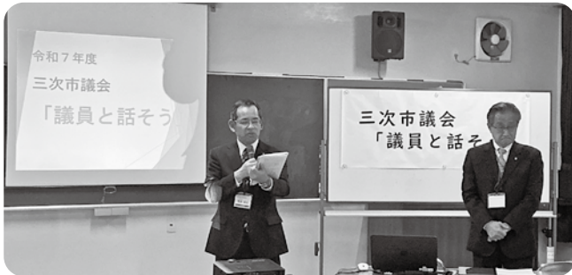
第1部活動報告 (粟屋会場)