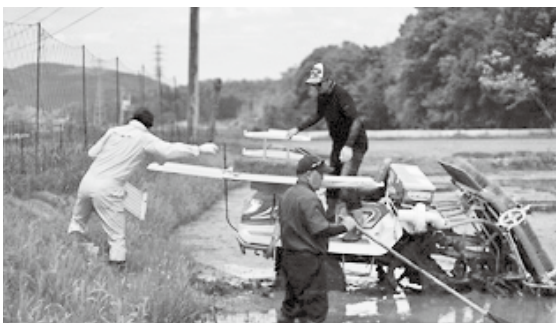
新規農業者の田植え風景

第2期三次市農業振興プランが最終年度を迎える中、次期プランの策定が進められている。第2期の成果と課題をどのように総括し、それを第3期プランへどう反映させていくのか。市の農業の未来像と策定方針を伺う。