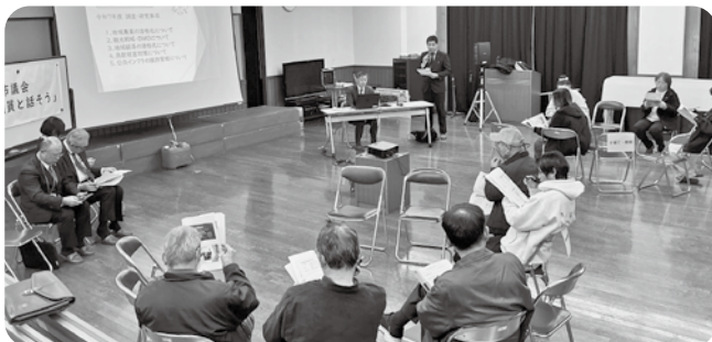
第1部活動報告 (田幸会場)