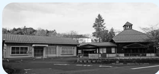
コミュニティセンターとして位置づけられる 仁賀集会所（左の建物）

隣接する仁賀コミュニティセンターと一体的に活用されている仁賀集会所をコミュニティセンターとして位置づけることとし、関係条例を改正します。