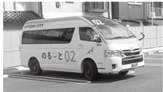
AI オンデマンドバス「のるひと三次」

地域の実情に適した移動手段を確保するため、中心市街地の周辺部でもAIやICTを活用し、利便性の高い交通ネットワークを構築すべきと考える。誰もが移動しやすい持続可能な公共交通網の整備について、市の考えを伺う。