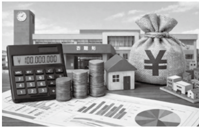
未来へつなく持続可能な自治体財政

昨年 11 月に策定された「令和 7 年度三次市実施計画・財政計画」では、令和 8 年度の経常経費だけでも約 5 億 4 千万円の赤字が見込まれている。実施計画にある投資的な事業を含めると、計画期間の最終年度にあたる令和 10 年度まで 10 億円規模の財源不足が発生することになる。この財源不足を解消するためには基金を取り崩して埋め合わせをしていくことになっているが、令和 11 年度以降も同様の財源不足が続く見込みなのか。