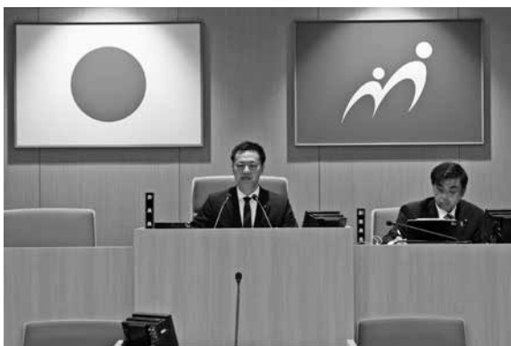
新年度予算、補正予算を審議