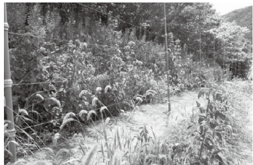
鉄鋼スラグを利用した電気柵の設置状況

実証地では電気柵の下地に鉄鋼スラグを併用することで、イノシシ、鹿などによる被害がほぼ解消されている。費用も安価で、国も導入支援を予算化している。市でも検討すべきと考えるがいかがか。