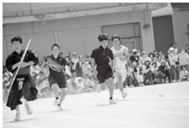
部活対抗リレー（十日市中学校体育祭）

文部科学省の指針には、中学校部活動は地域移行から展開へと示されている。展開となることでどう変わるのか。特に部活動の受け皿となる団体・指導者の不足等、多くの課題があると考えているが、その課題の克服に向け、部活動の地域展開をどう進めていくのか。