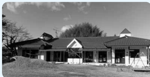
敷地保育所（吉舎町）

敷地保育所を令和 7 年度末で廃止することに伴い、関係条例から名称と位置を削除します。