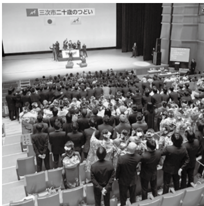
二十歳のつどいの様子

二十歳のつどいの出席状況を見ると、近年、女性の出席率が男性と比べて低い状況が続いている。特に市外に進学・就職している女性にとって、地元との関係を再確認する一つの機会ともなり得る。女性が参加しやすい環境づくりについて、今後どのように取り組んでいく考えなのか。