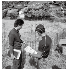
鳥獣害対策の研修風景

市の基幹産業である農業振興に向けた「第3期農業振興プラン」を策定し、新規就農者支援、スマート農業の普及、鳥獣害対策など、さまざまな重点課題の解決を図るとともに、国・県の施策や予算を有効活用できるよう研究・実践すべきと考えるがいかがか。