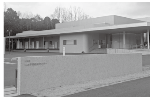
安心・安全な給食を（三次学校給食センター）

国は令和8年度から公立小学校を対象とした学校給食の無償化に向け準備を進めている。無償化導入後も物価高騰が予想され、栄養バランスの取れた献立や地産地消の取組等、子どもたちのために給食の質の向上が必要と考えるがいかがか。