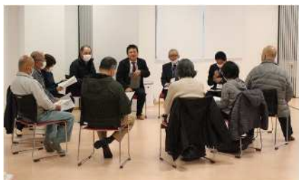
テーマに沿ったグループでのワークショップ

19の住民自治組織での常任委員会の活動報告と会場ごとのテーマに沿った意見交換会を開催しています。昨年から冬季開催に変更し、土日の開催も始めました。