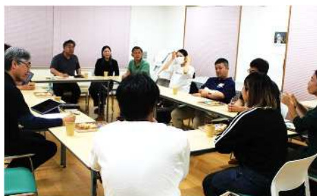
田幸地区の子育て世代のみなさんと意見交換