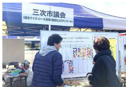
昨年の「みよし商工まつり」