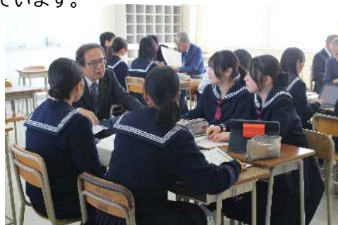
県立三次中学校での交流会

主権者教育の一環として、市内中学・高等学校の学生と議員との交流を行ったり、生徒のまちづくりへの提案を議会活動に取り入れています。