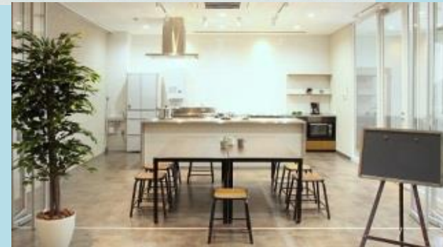
アシスタ ラボ lab.