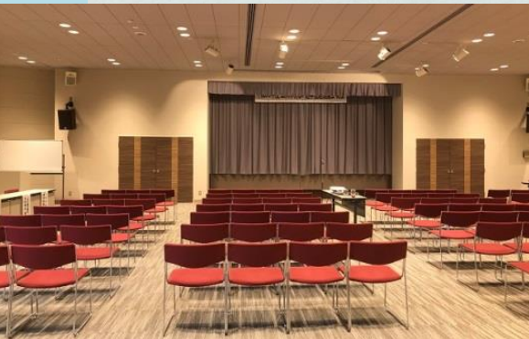
集会室(ペペラホール) 400人まで収容できるホールです。