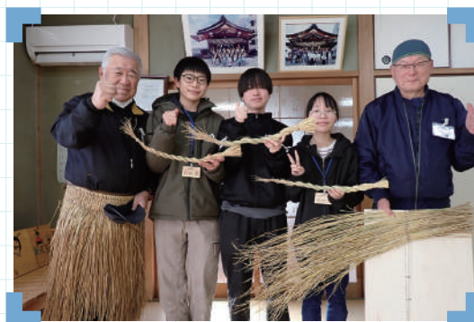
市内フィールドワーク「地元学」

そして、この取組を継続し、サステナアンバサダーの年代や活動の場を広げていくことで、「みよし」からみんなの未来を変えていきます。