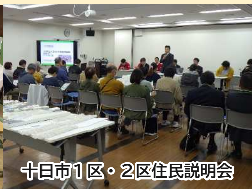
十日市1区・2区住民説明会