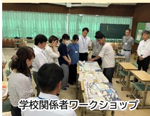
学校関係者ワークショップ