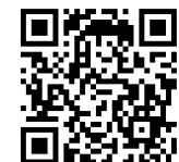
国税庁LINE公式アカウント

予約方法 (1) 電話予約：三次税務署個人課税部門 0824-62-2723(ダイヤルイン) (2) LINE予約：「国税庁LINE公式アカウント」から予約をお願いします。