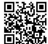
受付状況を確認する