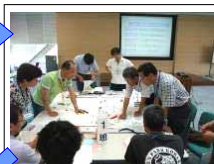
グループに分かれての話し合い