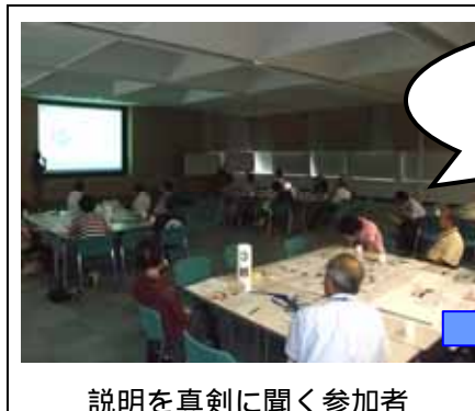
説明を真剣に聞く参加者