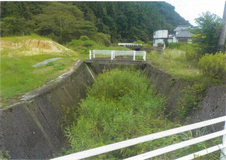
現 況 写 真