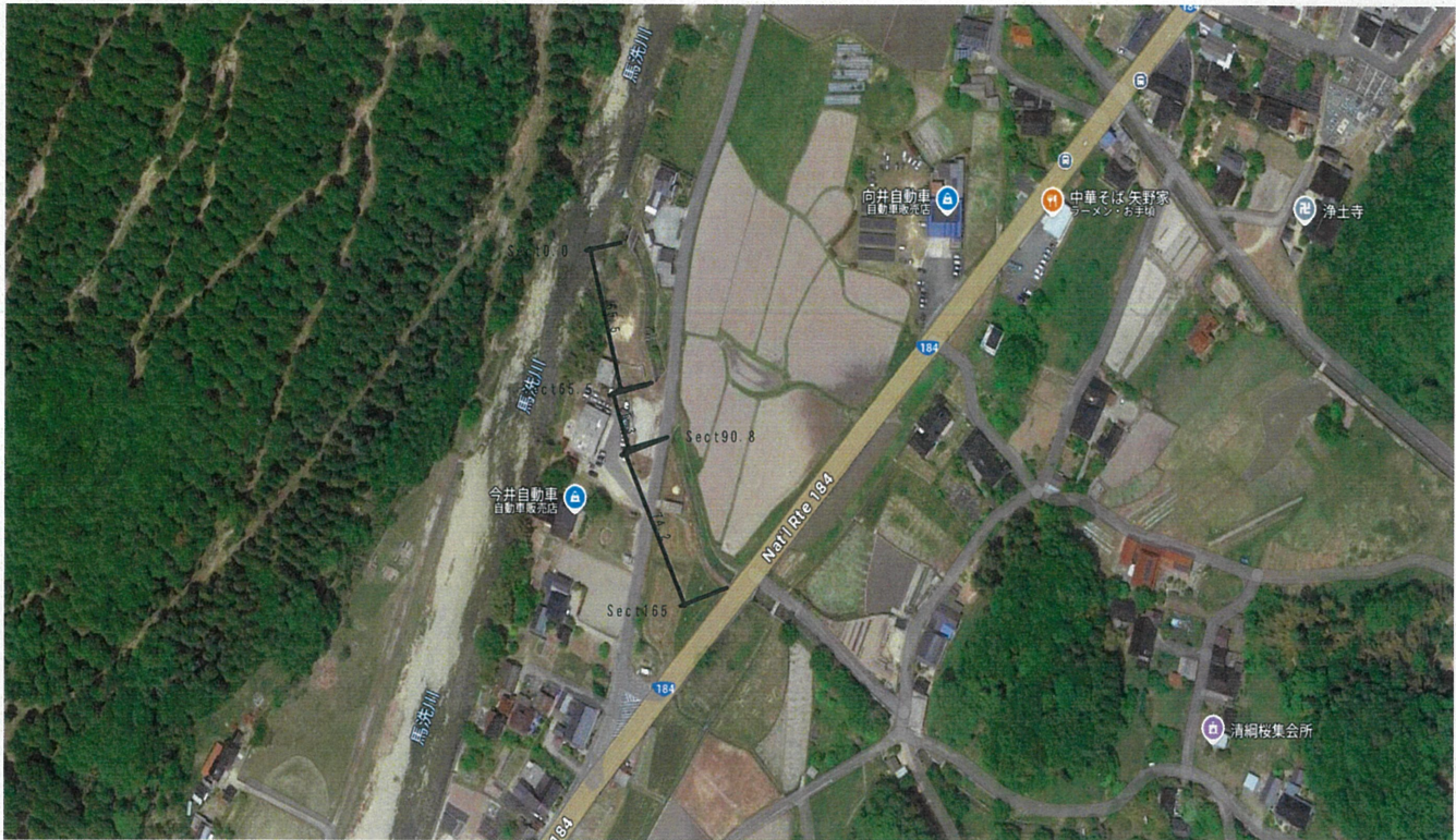
平 面 図