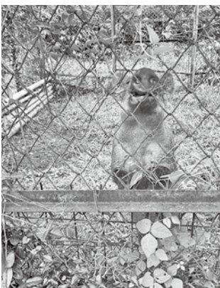
はこ農にかかったイノシシ

高齢化や人口減少が顕著な中山間地域で農業をはじめ、集落機能を維持していく上で有効な取組と考える。取組を進めていく過程においては、地域によって状況が異なるため、地域住民による十分な話し合いが必要であると考えており、市や農協などの関係機関も、その話し合いに参画していく必要があると考える。