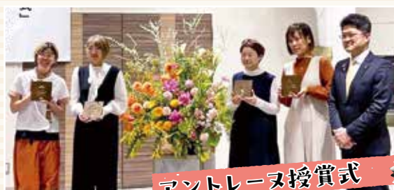
アントレーヌ授賞式