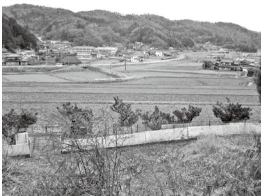
甲奴町の農地風景

また、トレタみよしの売場の面積拡大については、生産者や消費者のニーズに対応したサービスの創出が可能となるよう、周辺施設との機能分担も含め、今後、一体的に整備を検討していきたい。