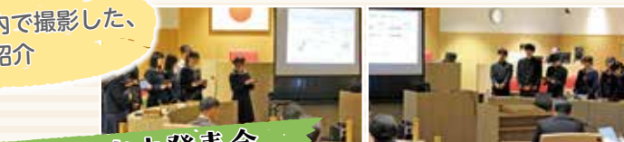
県立三次中発表会