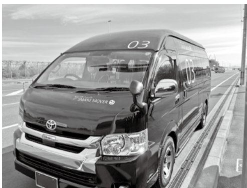
AI オンデマンドバス (広島市佐伯区五日市)

周辺にある保育所などの公的施設との連携や、将来的な更新を見据えたエリアの今後の在り方を検討していく必要があると考える。また、整備に当たっては地域住民や子どもたちの安全を第一に考え、できる限りハード面の整備を行うとともに、教職員等の防災意識の醸成や適切な避難行動についてもしっかりと考えていきたい。