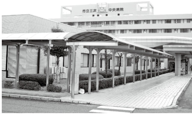
現在の市立三次中央病院