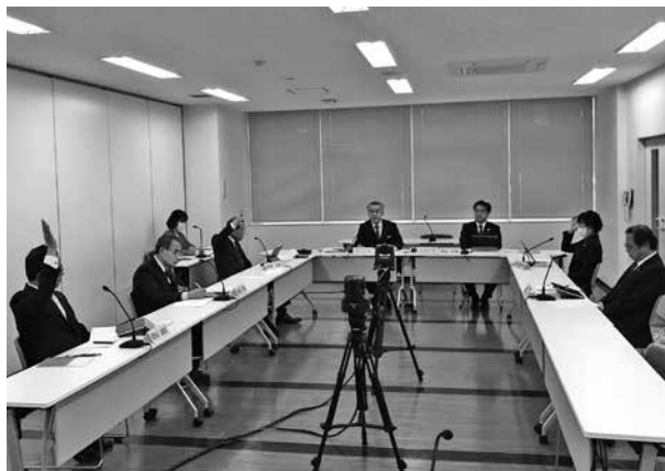
採決の様子(産業建設常任委員会)

次に、採択すべきであるとして述べられた内容としては、君田温泉の経営上の様々な課題や、取締役会や臨時総会等の課題についての説明を聞き、まだまだ我々がしっかりと検証しなければならぬ課題もたくさんあるように感じている。この請願の願意は、君田の宝である君田温泉をこれから先も君田町民、あるいは町の活性化、振興のために大事にしたい。たとえ事業者が変わったとしても、しっかりと支えていくぞという意味