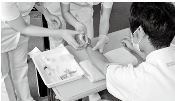
看護師研修の様子

夜勤が可能な看護師が不足しているため、夜勤が可能な看護業務の経験がある看護師に、一時的な支援として病棟業務に当たってもらった。再度病棟業務を覚える必要があったため、負担が生じたと感じている。また、病棟と透析室の一元化については、看護師の数も含め、新病院に向けて十分に他院の状況を調査し、運用が可能かどうかをしっかりと確認した上で進めていく。