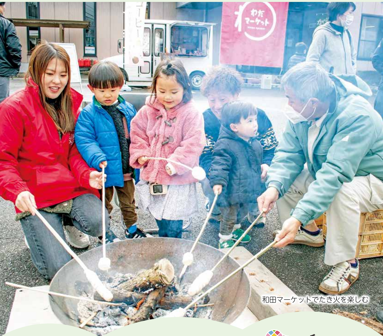
和田マーケットでたき火を楽しむ