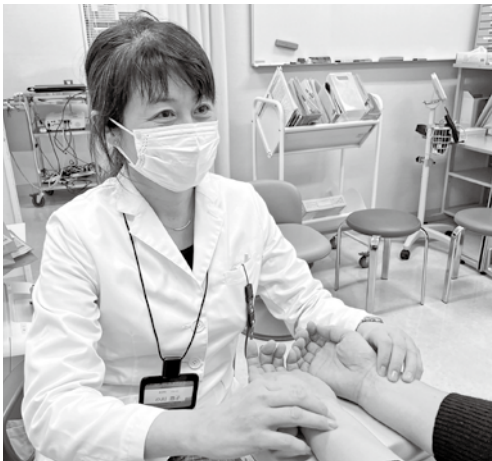
診療にあたる広島大学病院漢方診療センター医師

福岡市長 市立三次中央病院の基本計画の中にも漢方外来についての計画を記しているが、新規開設を実現していくためには、広島大学の協力というのは欠かせない状況であるため、開設に向けて引き続き大学へ要請しながら連携を深めていく。