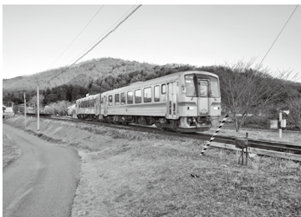
カーブ列車ラストラン (芸備線)

JR芸備線全線が対象となる、国の再構築協議会とは別に、広島―三次間に焦点を当てて利便性の向上策などを検討す