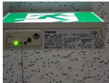
(モニタランプの緑点灯を確認)

※ モニタランプが点灯していない，点検用の引き紐を引いた状態でモニタランプが点灯していない場合は，バッテリーの不良なので交換してください。