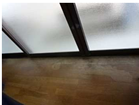
(結露による床損傷)