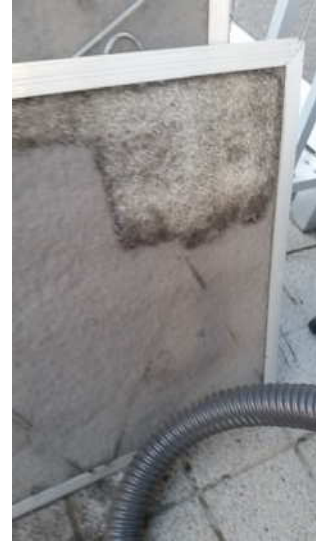
(フィルターに付着したほこり)

※ フロン排出抑制法に基づき、簡易点検（記録）を3か月に1回以上行うことが義務づけられています。