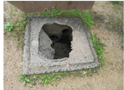
ますふた (柵蓋の破損)