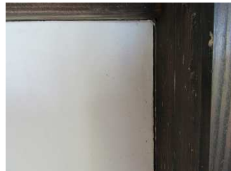
(壁と柱の間にできた隙間)