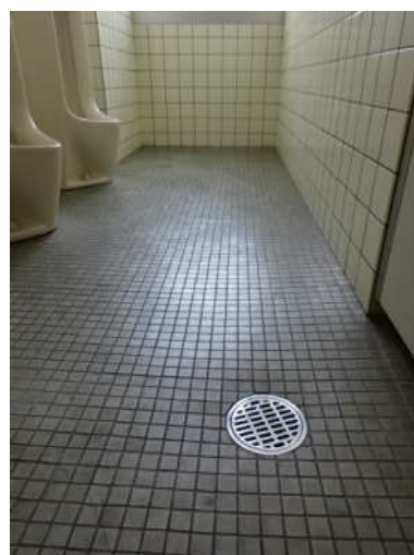
（床面の水洗いは控える）