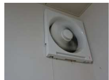
(正常に作動しますか?)