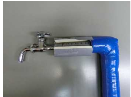
（保温材による水道管の保護）