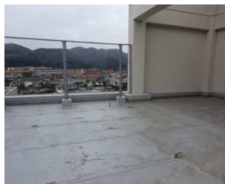
【フラットルーフ（陸屋根）】

通常業務にも多大な影響を及ぼします。傷みが目立ったり劣化が進む前に適切な処置が必要です。また、屋上に水が溜まっている状態を長く放置しておくとも防水層の劣化を早めることとなります。屋上には、雨を適切に処理するため、ルーフドレイン（屋上排水口）や樋が設けられています。雨漏りの多くの場合が屋上排水口の詰まりが原因です。屋上排水口の清掃は建物の維持管理の基本です。