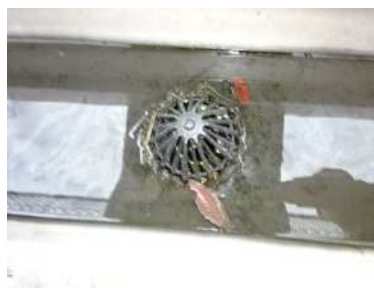
（屋上排水口に溜まった水）