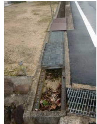
(土砂や枯葉の堆積)