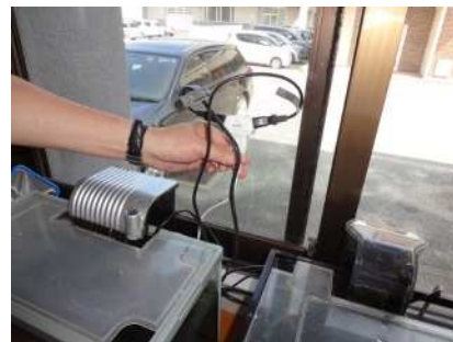
(プラグのたこ足配線)