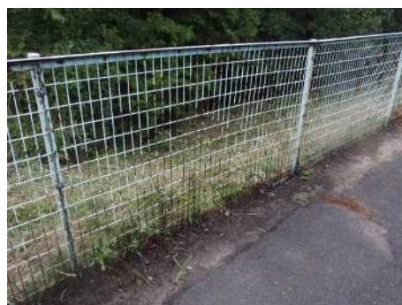
（フェンスに発生したサビ）