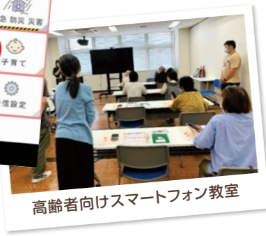
高齢者向けスマートフォン教室