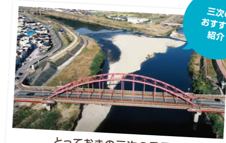
とっておきの三次の風景をドローン撮影で紹介