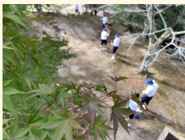
三次中学生さんによる清掃