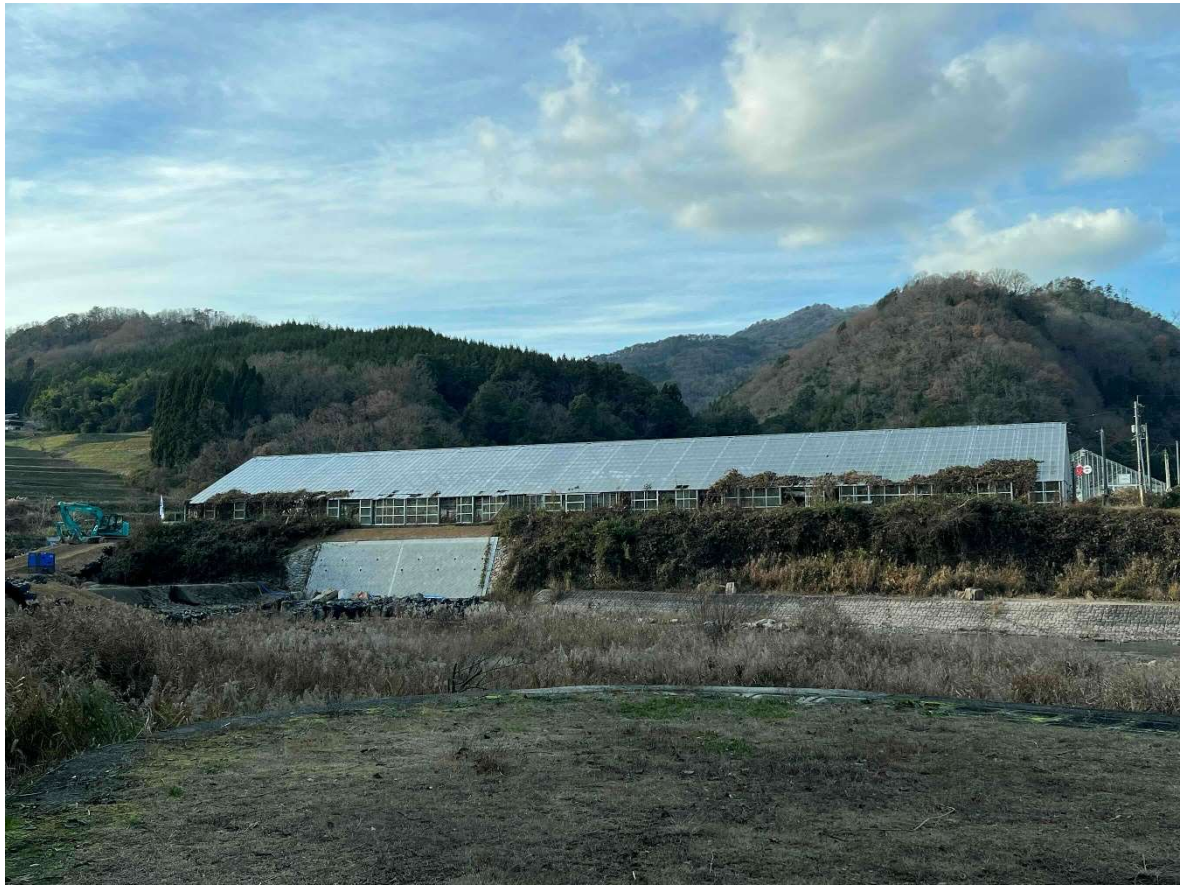
土砂災害警戒区域・土砂災害特別警戒区域