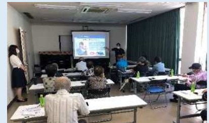
高齢者向けスマートフォン教室