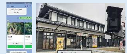
データ利活用スマートシティ事業