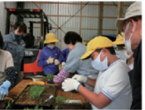
森の学習（植林体験）