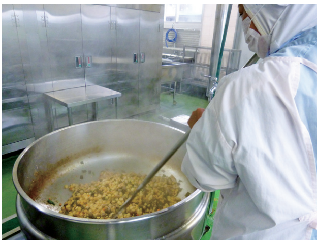
大釜での調理風景