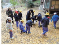
遊具神社での秋見つけ