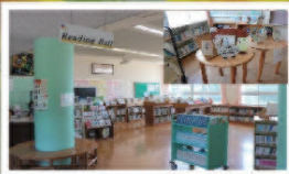
リーディングホール