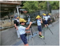
ブッポウソウの保護活動