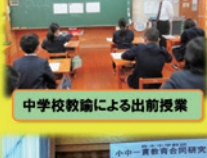
中学校教諭による出前授業