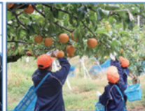
高丸農園体験学習