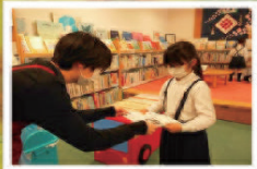
君田図書館との連携