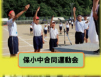
保小中合同運動会