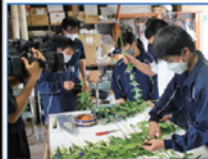
リンドウ農園体験学習