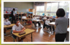
ブックトーク朝会