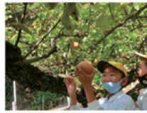
高丸農園 梨の収穫体験