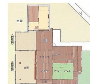
奥家住宅の間取り