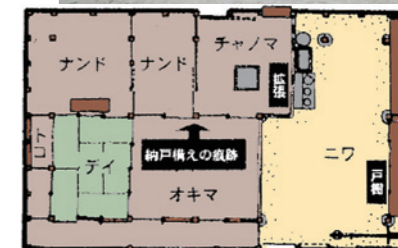
旧真野家住宅の間取り (現状18世紀初頭頃) 「旧真野家住宅と古民家」(比治山大学短期大学教授 迫垣内 裕「みよし風土記の丘 No.75」)から作成