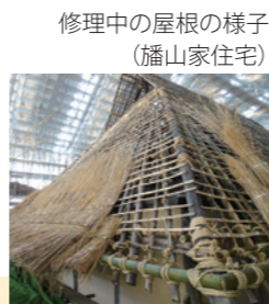
修理中の屋根の様子 (幡山家住宅)

雨の多い日本では家屋を風雨から守るため、軒を長く出し工夫を重ねました。草葺や板葺が多く、地域によっては石で屋根を葺いていました。次第に防水性や防火性、耐久性に優れた材料を求めて発展し、瓦屋根が使われるようになりました。