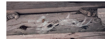
熊野神社枇杷板の絵