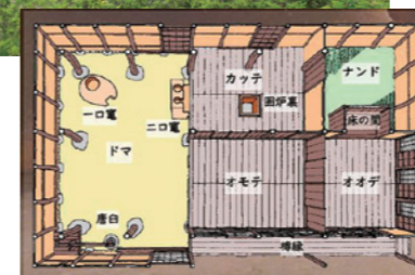
幡山家住宅の間取り