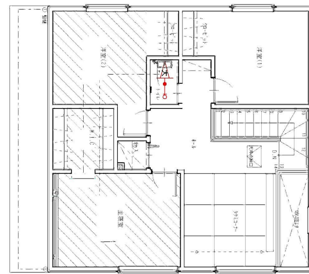
2階 平面詳細図 S:1/100