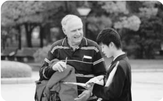
英会話チャレンジ