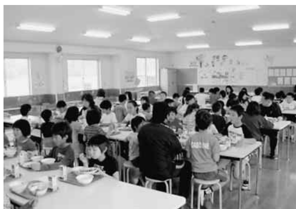
食堂でみんな楽しくおいしい給食

1 3 か所の調理場の学校栄養職員は、それぞれの地域性に配慮した独自の献立を立てています。