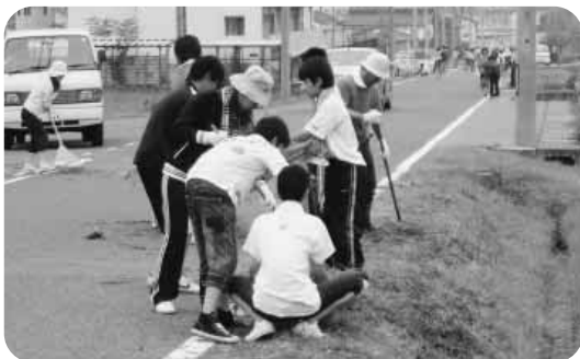
ボランティア活動（フラワーロード清掃）