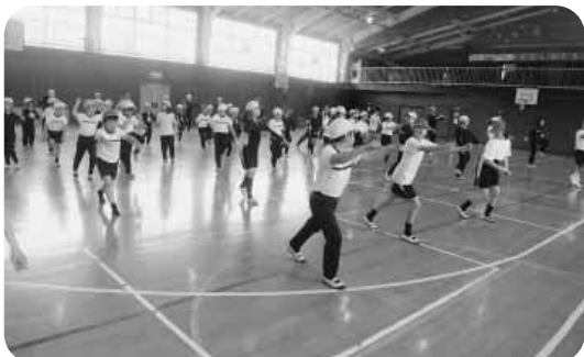
みよし体操（布野っ子トレーニング）