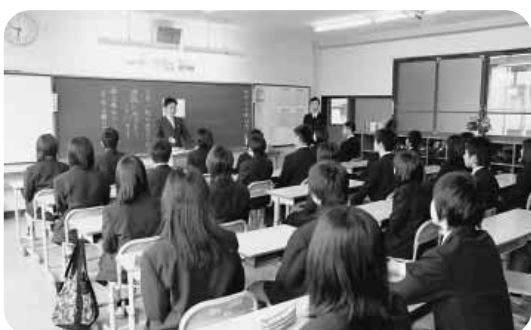
学びの心構え（着ベル・姿勢）