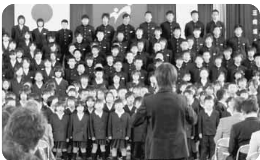
小中一貫教育の推進～小中合同研究会での合唱風景～