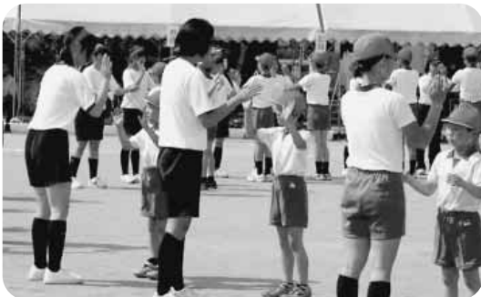
小中合同運動会でのダンス風景