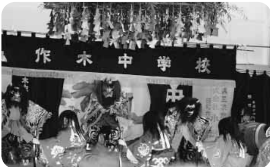
地域の伝統芸能、文化の継承（神楽）