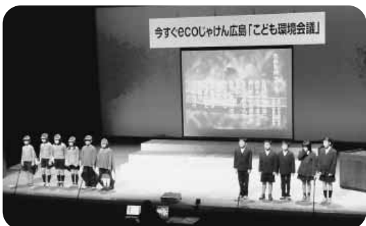
ブッポウソウの保護活動発表 ～子ども環境会議にて～