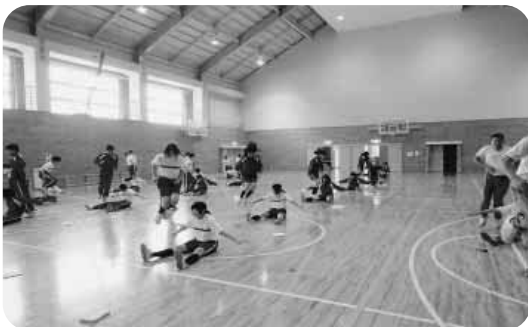
心身を鍛えるパワーアップタイム