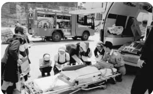
体験を効果的に授業へ導入