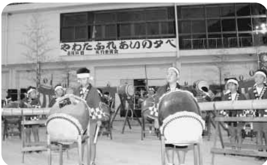
やわた子ども太鼓