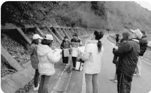
安田子ども自然ガイド