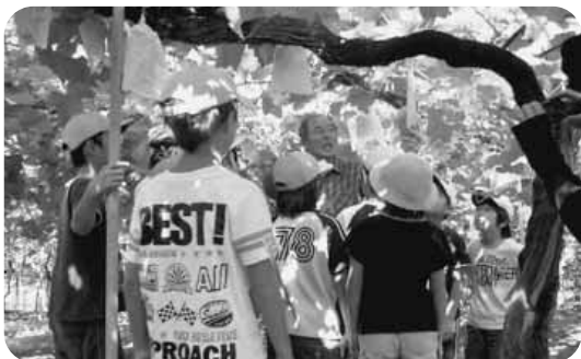
ぶどう作り～地域素材を生かして～