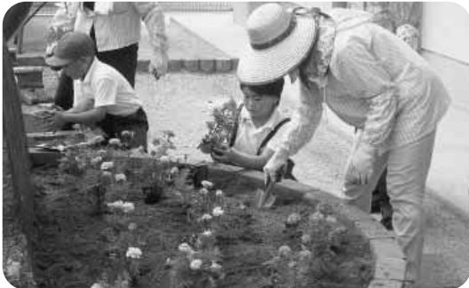
地域の方の協力を得て、活動する園芸委員会