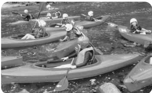
長期宿泊体験活動「カヌー公園さくぎ」にて