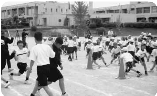
三和チャレンジデーに小中合同で参加