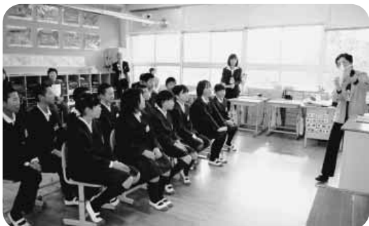
ゲストティーチャーによる読み語り