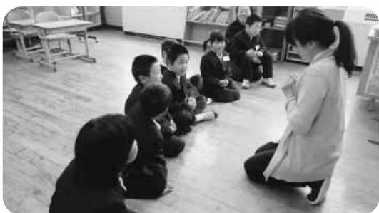
エンジョイイングリッシュ風景