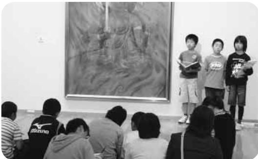
奥田元宋・小由女美術館を活用した授業