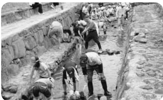
川の浄化活動（焼炭入れ）