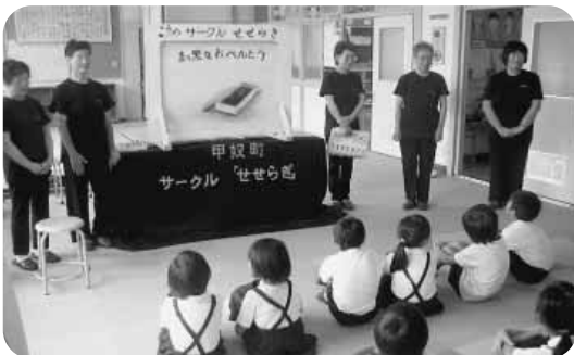
地域の方の読み聞かせ