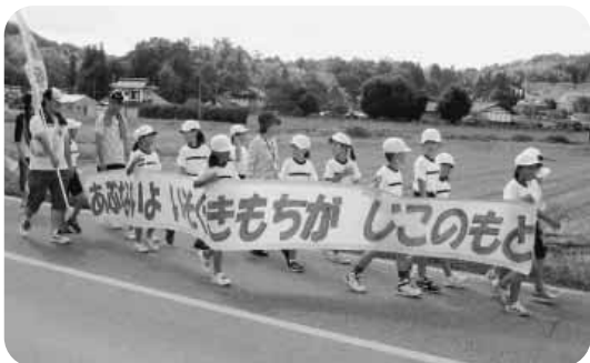
交通安全パレード