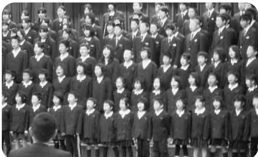
三和中小連携合同合唱