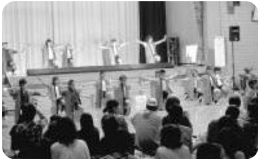
よさこいソーラン (粟屋町民文化祭)