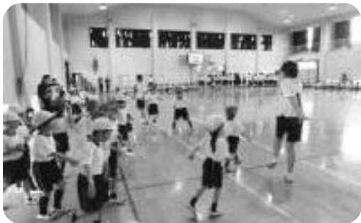
小中合同チャレンジデー