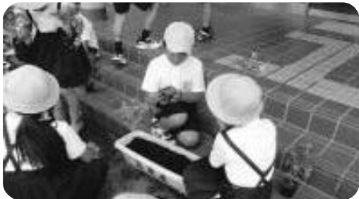
花いっぱい作戦 ～民生委員さんとの交流～