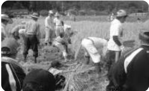
米づくり体験活動（稲刈り）