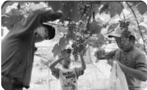
ぶどう作り～地域素材を生かして～