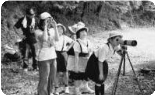
ブッポウソウ観察会