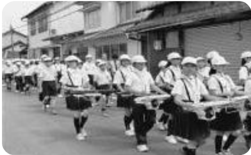
交通安全をよびかける鼓笛演奏での交通パレード