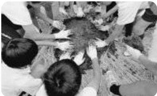
歴史まるごと体験6年（県立歴史民俗資料館出前授業 土器焼き）