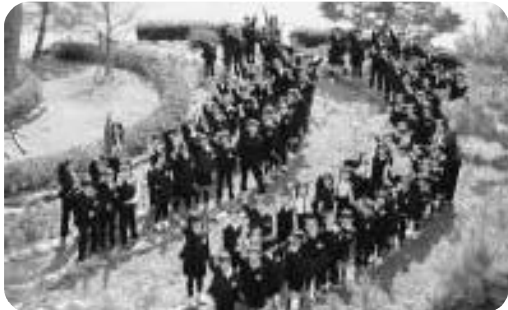
「七本松」と共に スタートしています