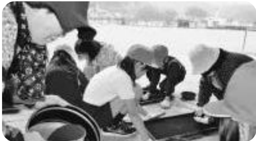
地域の方（女性会の方との体験活動 種蒔植付）