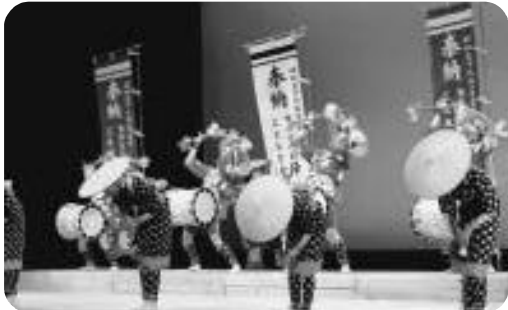
(伝統芸能 沖江田楽)