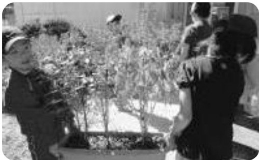
社会貢献「のぞみプラン」