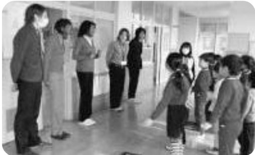
イングリッシュデイ