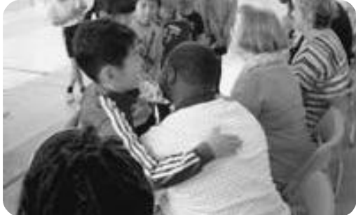
アメリカス市との交流