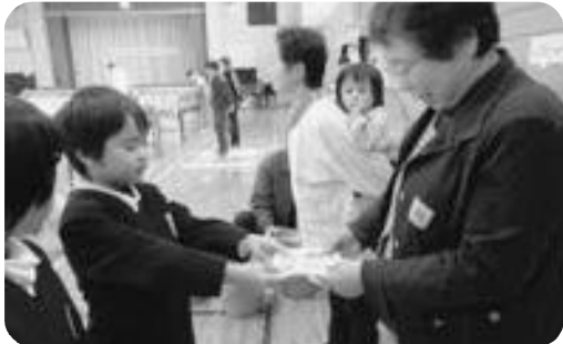
地域とのふれあい（農産物品評会）