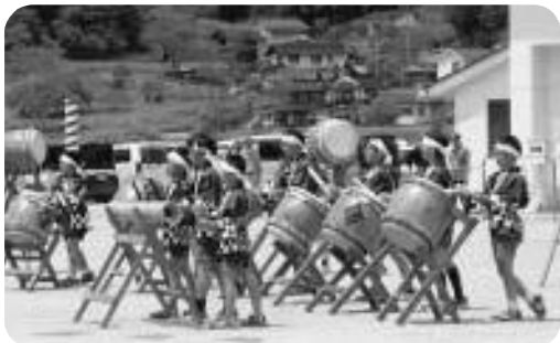
やわた子ども太鼓