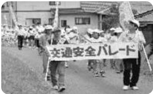
交通安全パレード