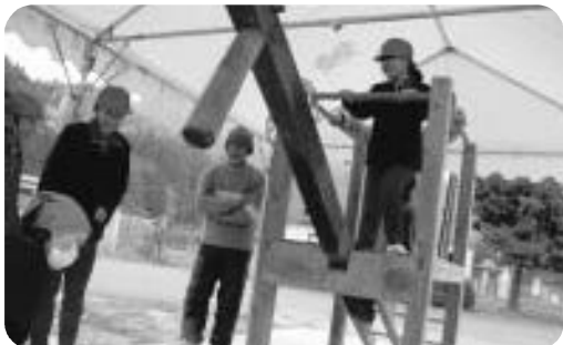
50年前の米作りの再現