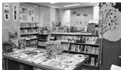
三次市立三良坂図書館