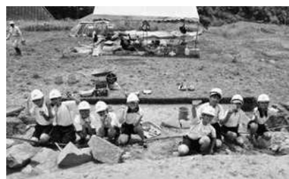
史跡寺町廃寺跡発掘調査 (市内小学校 発掘体験)