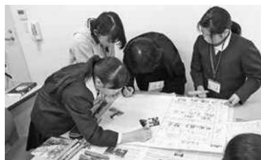
子ども司書の活動