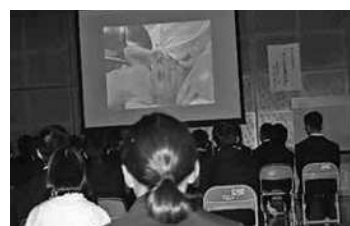
中学校での命の授業