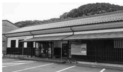
三次市立布野図書館