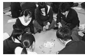
高校での「親プロ」講座

不登校、ひきこもり、ニート、非行などの子どもや若者に対する社会的自立に向けた支援に関する仕組みづくり