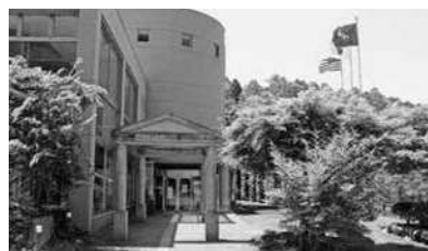
三次市立甲奴図書館