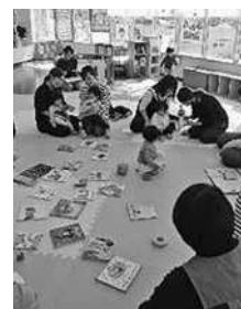
子育て支援センターでの「親プロ」講座