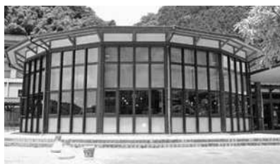
三次市立作木図書館