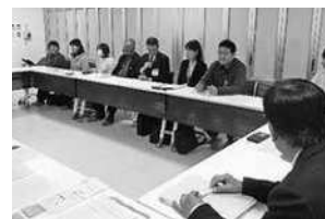
家庭教育支援チーム結成式

三次市社会教育委員会議では、社会教育の推進のための計画立案や、「家庭教育は、基本的な生活習慣や社会規範などを身につけるうえで全ての教育の出発点」として、家庭教育力向上をめざした、家庭教育支援などの取り組みを行っています。