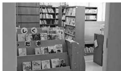
三次市立吉舎図書館