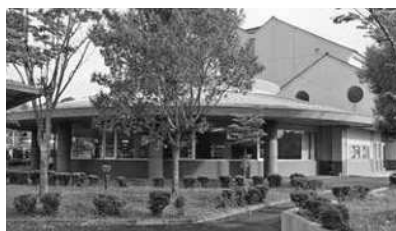
三次市立三和図書館