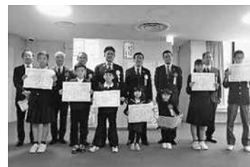
「わが家の1か条」募集表彰式