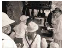
ブッポウソウの保護活動