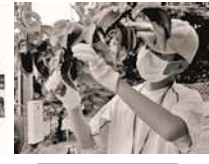
高丸農園体験学習