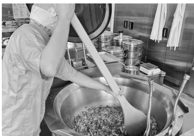
大釜での調理風景

三次市教育委員会配置の栄養士及び12箇所の調理場の学校栄養職員等は、それぞれの地域性に配慮した独自の献立を立てています。