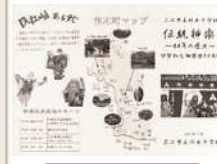
神楽パンフレット作成