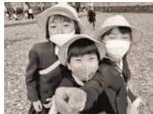
道具神社での秋見つけ