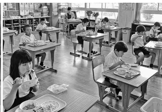
密を避けて静かに完食