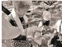
作木の製作りの学習