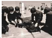
野生動物とともに