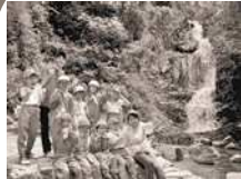
常清滝での川遊び体験