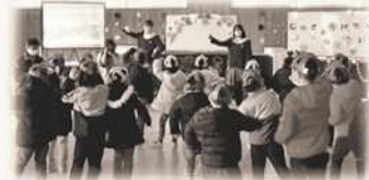
小中高合同ボランティアクリーン活動