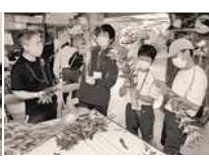
リンドウ農園体験学習