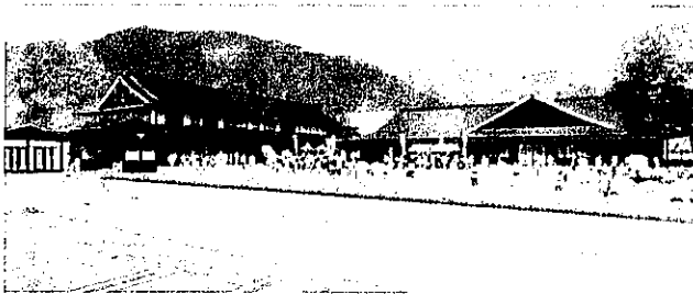
湯本蒙一記念 日本妖怪博物館（三次もののけミュージアム）