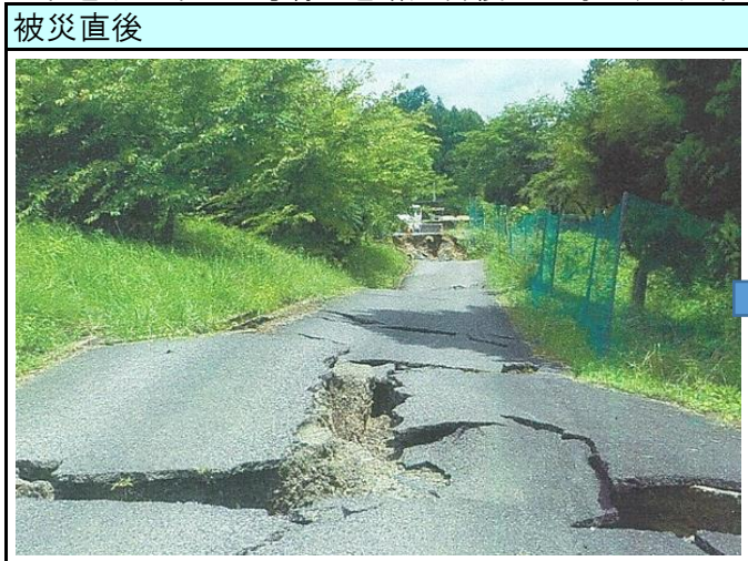
市道十日市276号線 道路災害復旧工事（三次市十日市町）