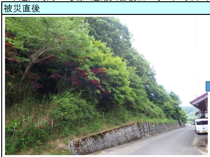
市道戸河内61号線 道路災害復旧工事（三次市布野町戸河内）