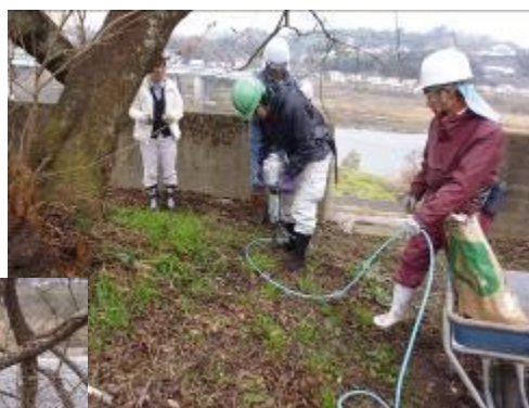
専用の機械で根本近くに約60cmの深さの穴を掘り肥料をまきます。