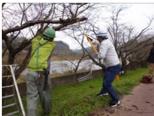
枯れ枝や罹病枝を剪定します。