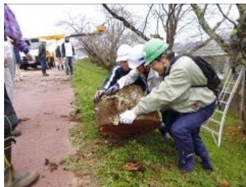
力を合わせて切株を運びます。