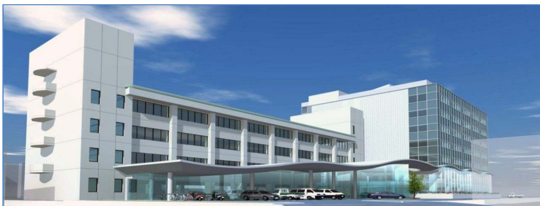
新庁舎完成予想図

人口減少・少子高齢社会という厳しい現実と直面する中、市民のしあわせの実現をめざす三次市総合計画を着実に実行するため、限られた財源を本当に必要なことに有効活用する行財政改革を徹底して推進します。