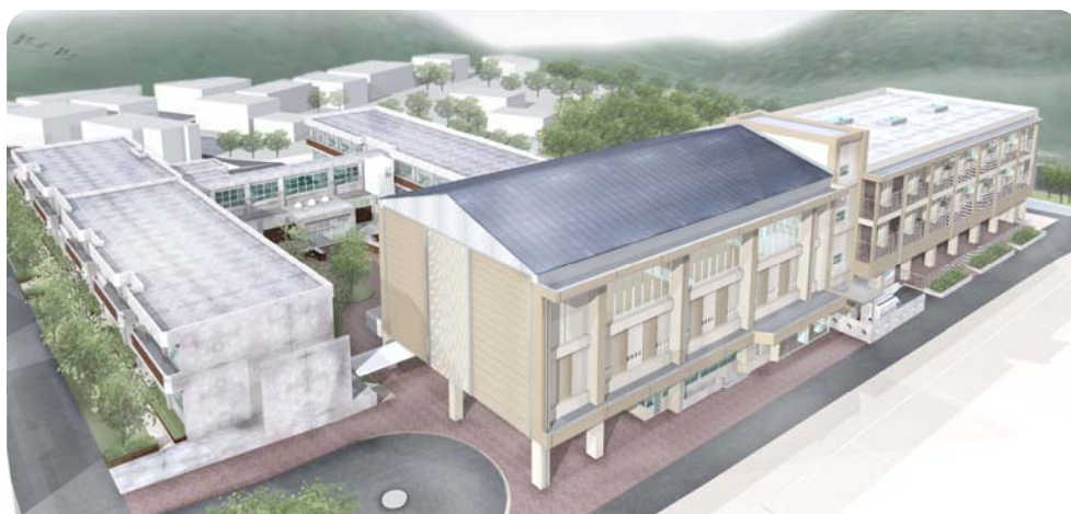
三良坂小中一貫教育校完成予想図