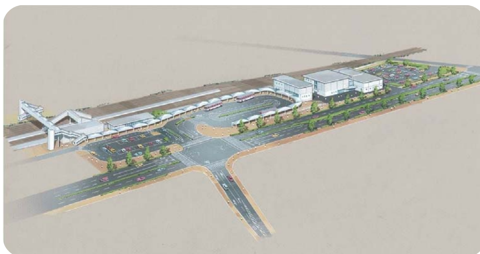
三次駅周辺整備事業完成予想図