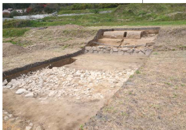
史跡寺町廃寺跡 金堂跡