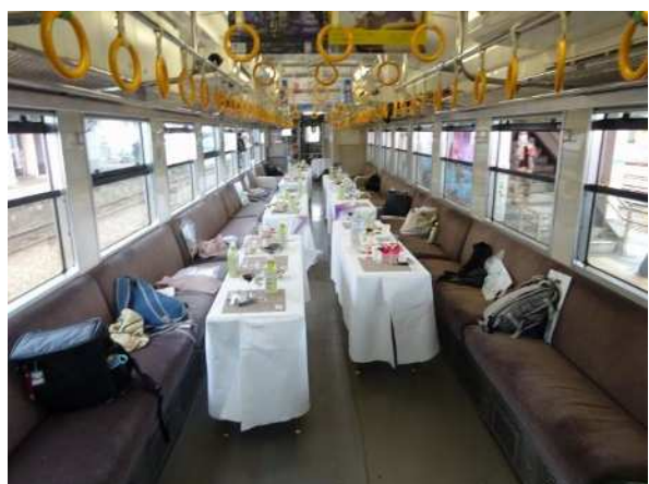
三次駅でのお出迎えの様子（右下は車内の様子）