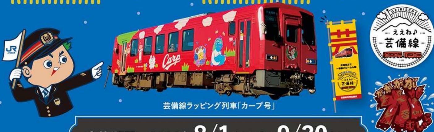
芸備線ラッピング列車「カープ号」