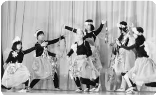
地域での聞き取りや体験活動をもとにした全校劇「ホテル舞いとぶふるさと」