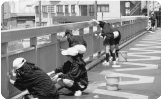
全校ボランティア活動