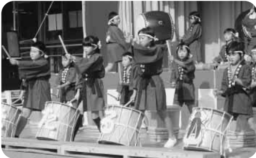
ほたる太鼓の発表