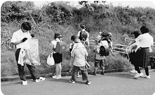
小中合同清掃活動