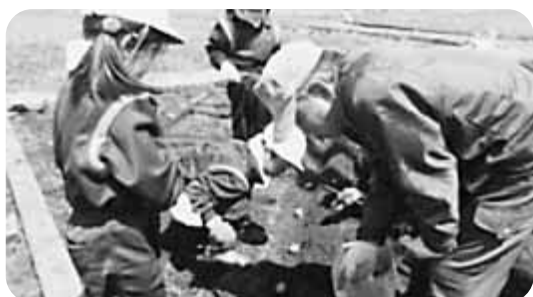
地域とのつながりで、将来への力を育てています。