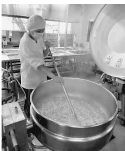
おいしそうない匂いがしてきました

三次市教育委員会配置の栄養士及び13か所の調理場の学校栄養職員等は、それぞれの地域性に配慮した独自の献立を立てています。