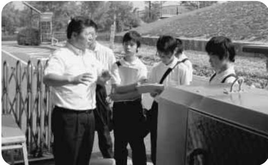
総合的な学習の時間「調査・研究」