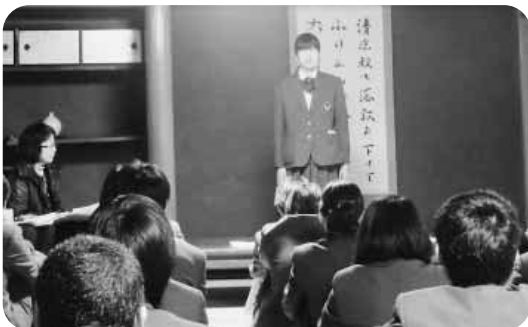
中村憲吉記念館で短歌交流会