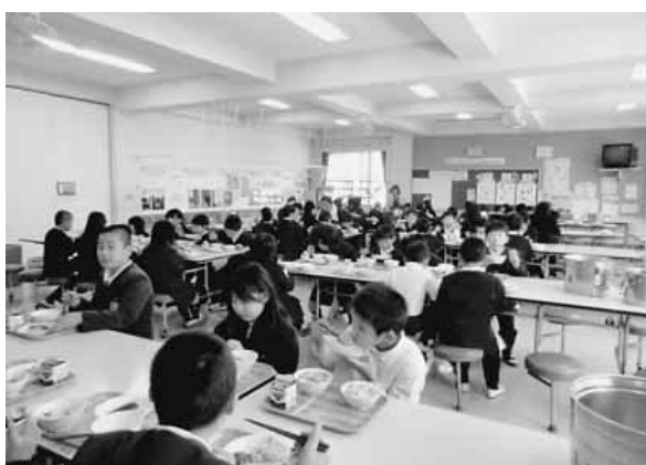
食堂でみんな楽しくおいしい給食