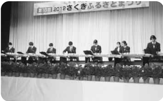
箏の発表（さくぎさるさとまつりにて）