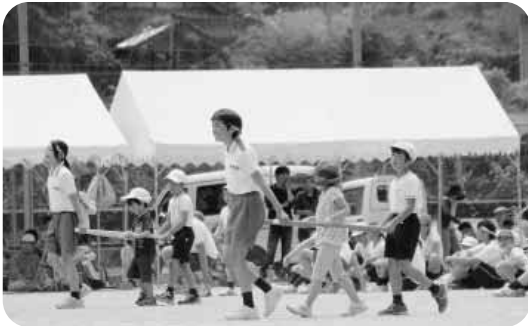
保小中合同運動会