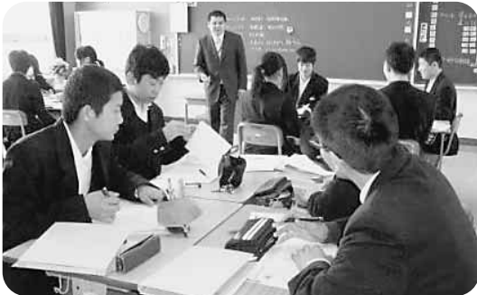
ピア・サポート&協同学習