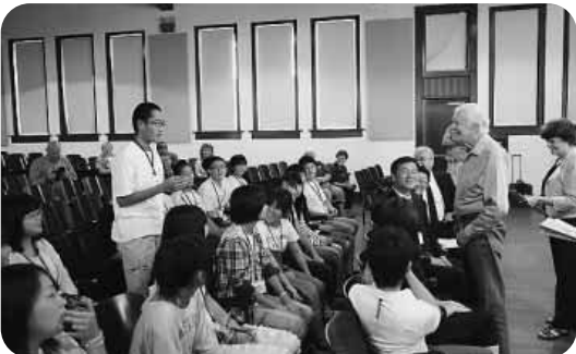
アメリカス市訪問