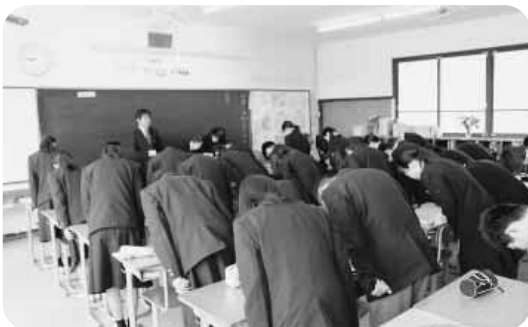
学校での6つの約束（学習の構え）