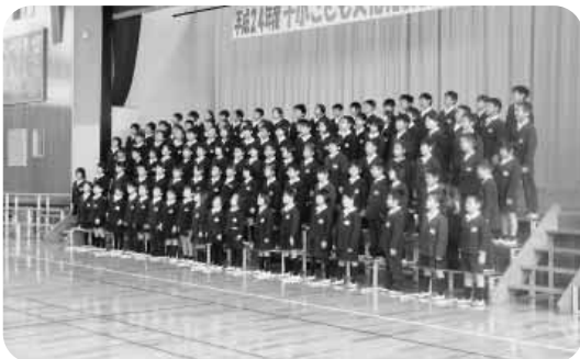
十小子ども文化発表会