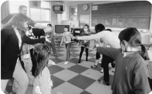
「English Day」の開催（全学年外国語活動）