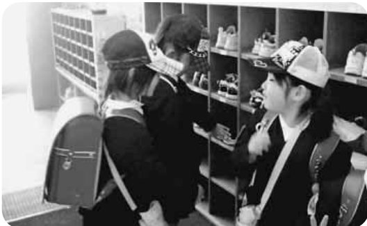
自慢づくり くつそろえの仕方を教える