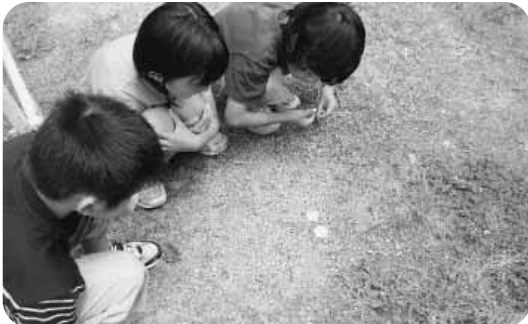
科学研究（蟻の研究）