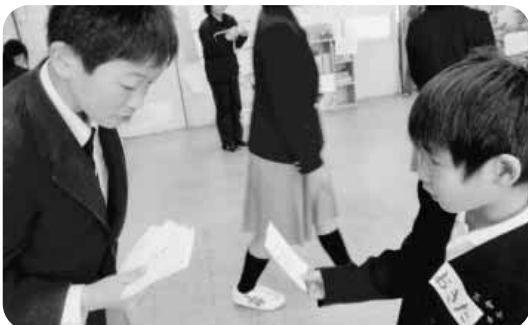
リトルティーチャー（中学生が小学生に英語を教えています）