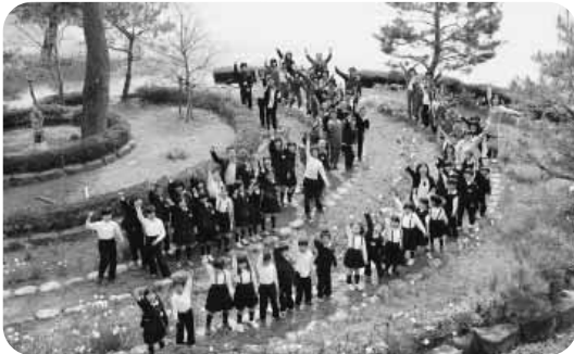
七本松とともに今年もスタート