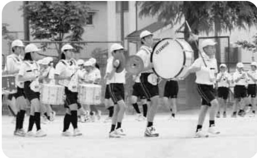
運動会での鼓笛演奏