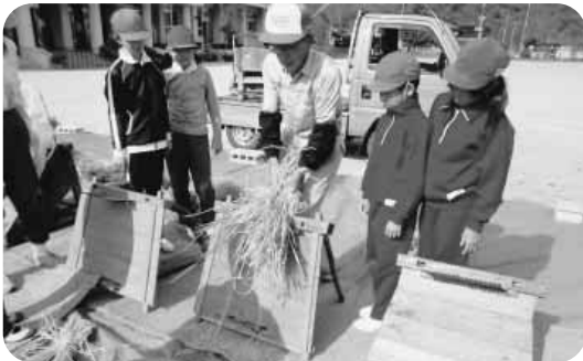
米作りの学習（50年前の米作りの再現）