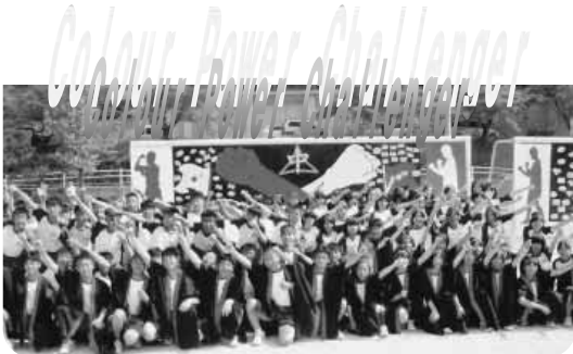
体育祭「生徒会スローガンと全校写真」