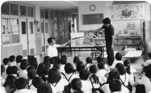
PTAによる読み語り朝会