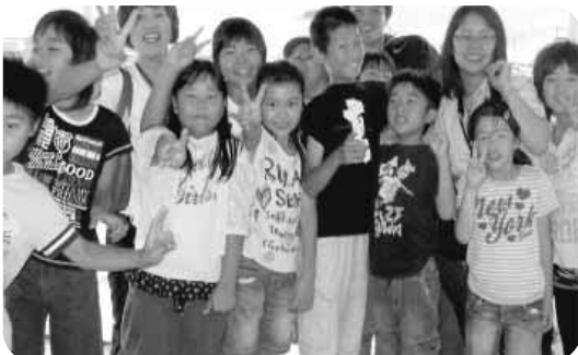
三原市佐木島でのキャンプ（光る海！そして友達的笑顔！！）