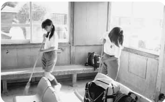
全校クリーン活動（吉舎駅清掃）