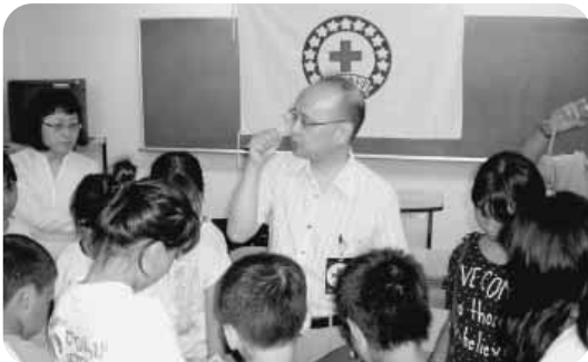
サマースクールでボランティアの話を聞く