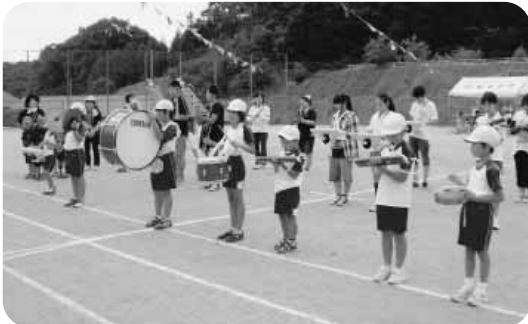
運動会にて保護者や先輩たちとの「鼓笛隊」