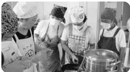
食生活改善推進委員の協力で郷土料理に挑戦