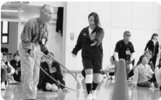
老人会のみなさんとの「ふれあい運動会」