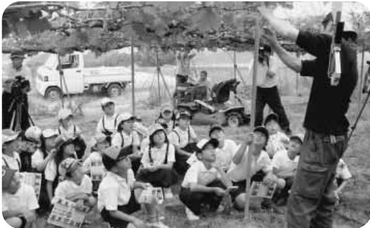
地域での学習 第3学年ピオーネ探検隊